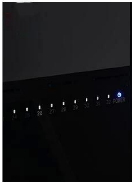
Blue light flashes when data transfer