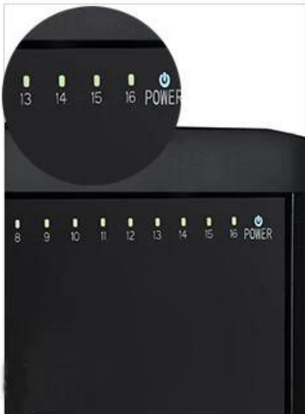
When the device is charging the green light